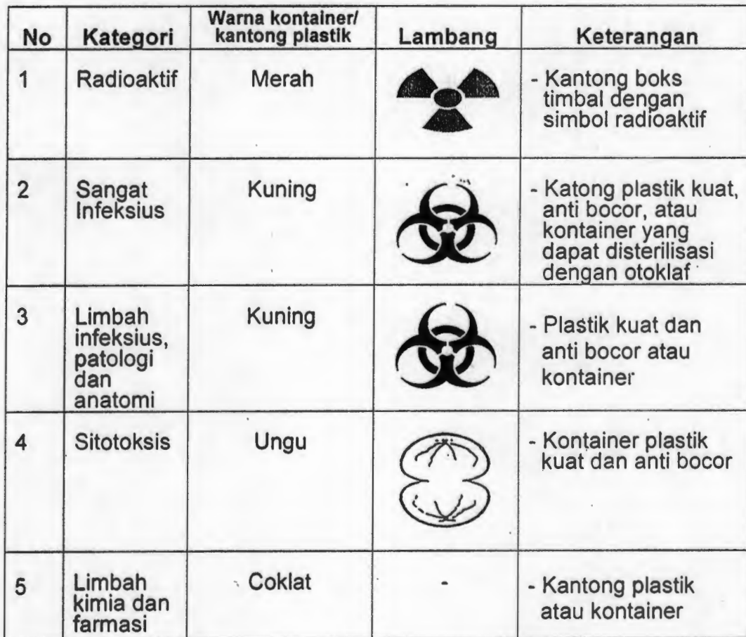
Tabel 1.11 Jenis Wadah dan Label Limbah Medis Padat Sesuai Kategorinya