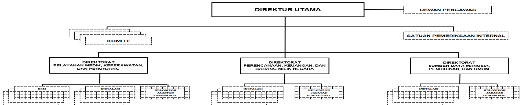
BAGAN STRUKTUR ORGANISASI RUMAH SAKIT JIWA Prof. Dr. SOEROJO MAGELANG