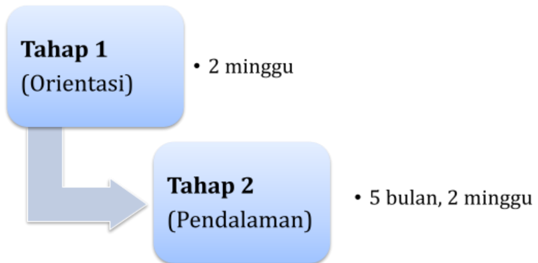
Gambar 3. Tahapan Program fellowship Spesialis Onkologi Radiasi. Sebagai syarat kelulusan peserta program fellowship harus membuat laporan kasus minimal 1 (satu) yang harus dipresentasikan di forum ilmiah di dalam ataupun di luar negeri dan satu makalah berupa tinjauan pustaka, systematic review , atau suatu metaanalisa.